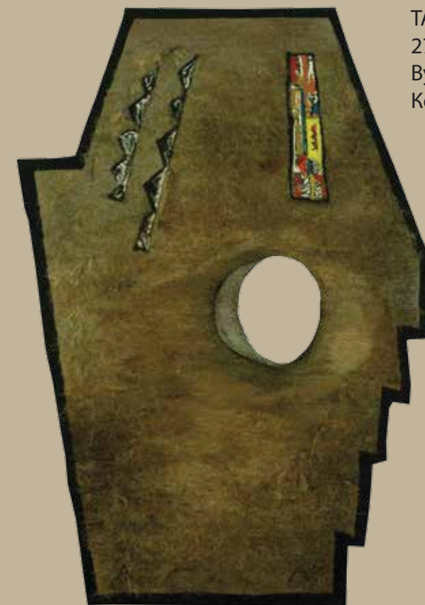
ТАПИСЕРИЈА ИЗ БОСНЕ, 2012/13. 275 x 199 цм Вуна, сисал, клечана техника Коаутори: Божић Јелена, Грбић Весна