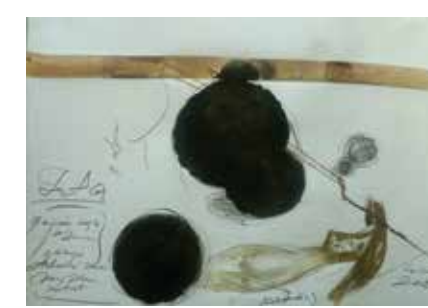
Скице за инсталацију "Архаични часови" 2019. техника: лавирани туш